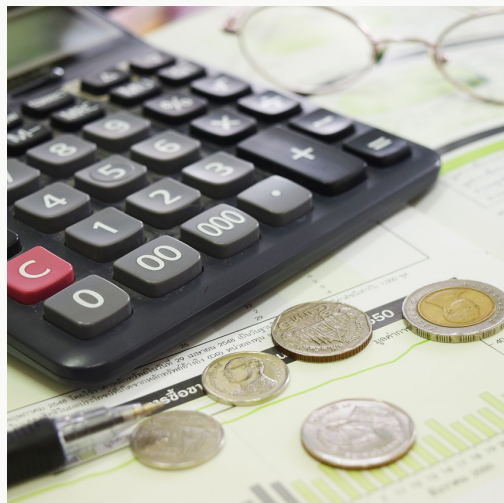
Iqtisodiyot (moliya va buxgalteriya hisobi)