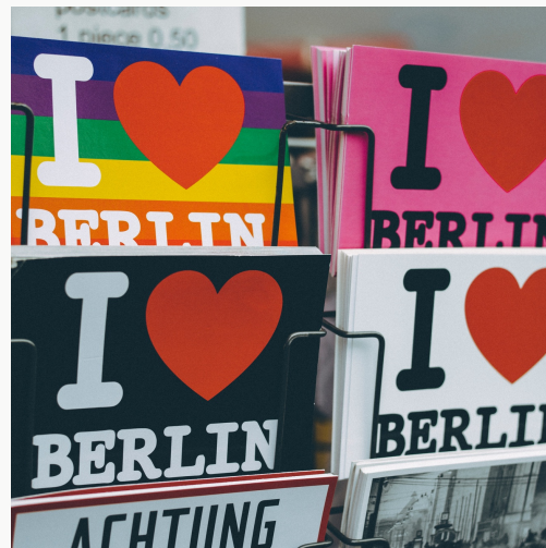
Xorijiy filologiya (nemis tili)