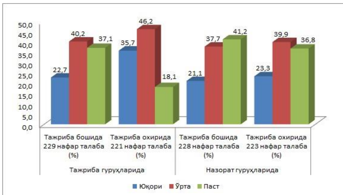
Termiz davlat universiteti va Termiz davlat pedagogika insitutida olib borilgan pedagogik tajriba-sinov ishlari natijalari diagrammasi